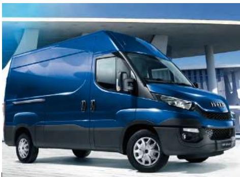
Dodávky a podvozky s různými nástavbami

CNG - Vyzrálé řešení pro široké použití Dnes již bezproblémové tankování nejen v ČR ale celé Evropě EMISE lepší než EuroVI