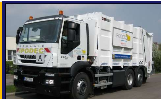
Komunální vozidla 4x2 a 6x2

CNG - Vyzrálé řešení pro široké použití Dnes již bezproblémové tankování nejen v ČR ale celé Evropě EMISE lepší než EuroVI