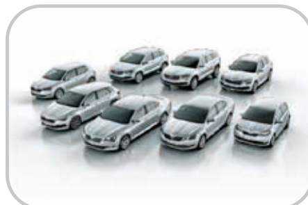
Nová fleetová nabídka