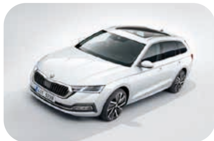
OCTAVIA IV. generace