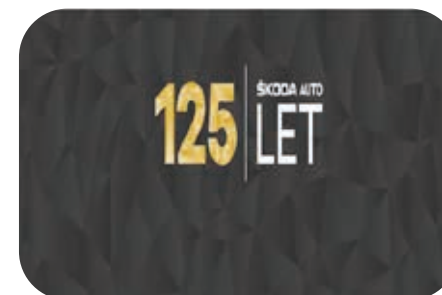
125 let ŠKODA AUTO